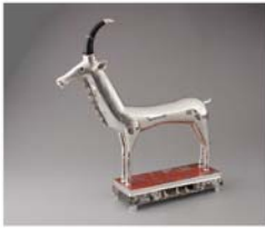
Christophe Boust, 1988. Argent massif, 10 cm. Musée de la Ville de Paris, Paris.