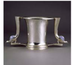
Christophe Boust, 1988. Argent massif, 10 cm. Musée de la Ville de Paris, Paris.